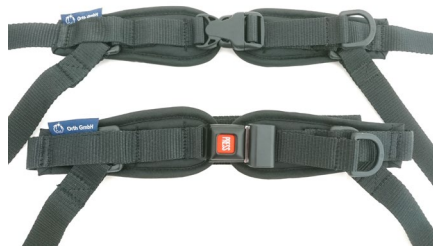
4 Punkt Beckenpositionierung